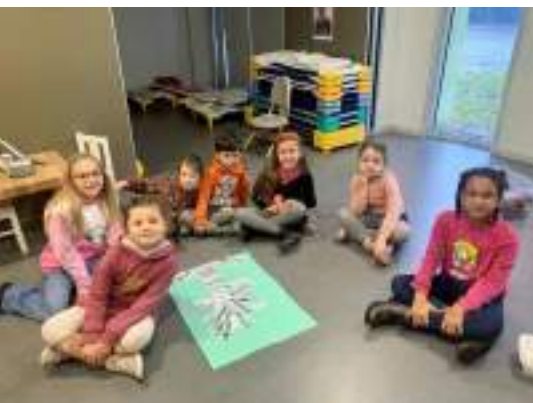
Atelier d'écriture et de calligraphie