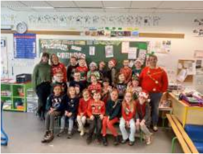
Journée pull de Noël

Encore une période bien remplie dans la classe des GS CP de Maitresse Sandrine :