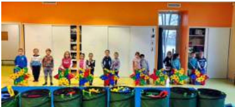
Journée de construction financée par le Sou des Ecoles