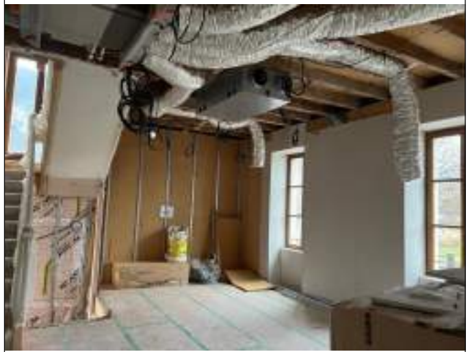
Le Rdc : l'espace commun...