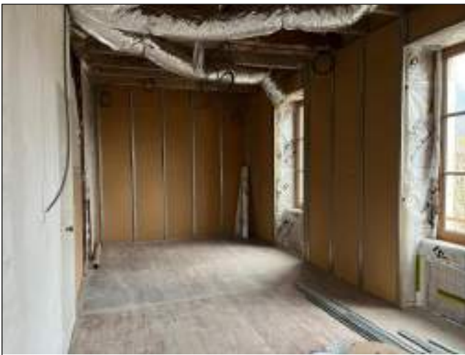
L'étage : la salle de réunion