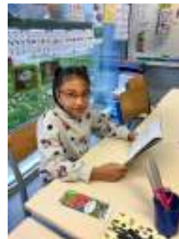
Les CP sur la route de la lecture autonome