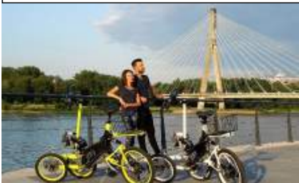
GAMME VAE : vélo droit électrique, possibilité en option d'une canopée solaire. Utilisable sur voie publique et pistes cyclables.