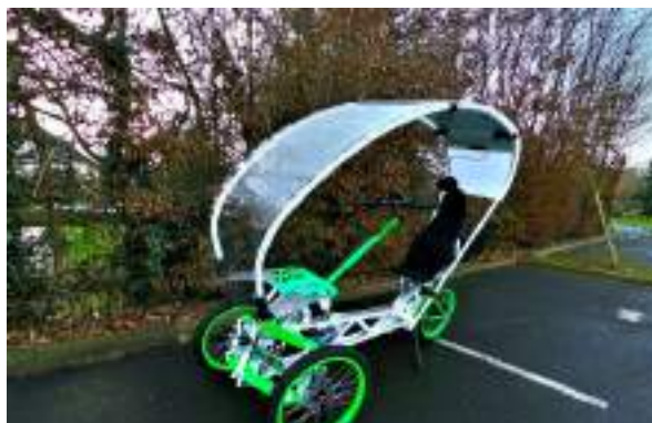
GAMME VAE : vélo semi-couché électrique, équipé de sa canopée à panneau solaire. Utilisable sur voie publique et pistes cyclables.