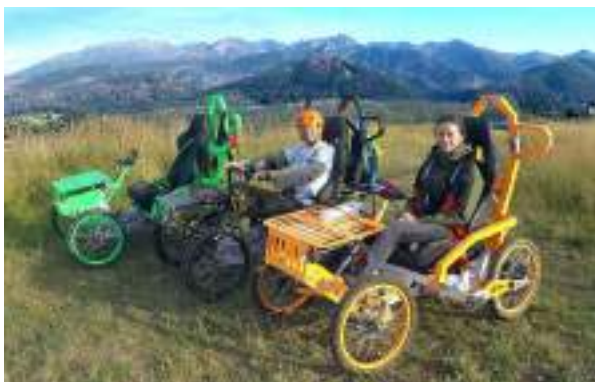
GAMME Loisir : le Moutain Cart. 2 moteurs électriques, pour usage en domaine privé. Usage PMR possible.