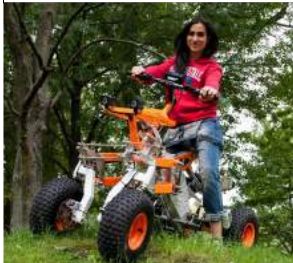
GAMME Loisir : le Off-Road Quad. 2 moteurs électriques, pour usage en domaine privé.