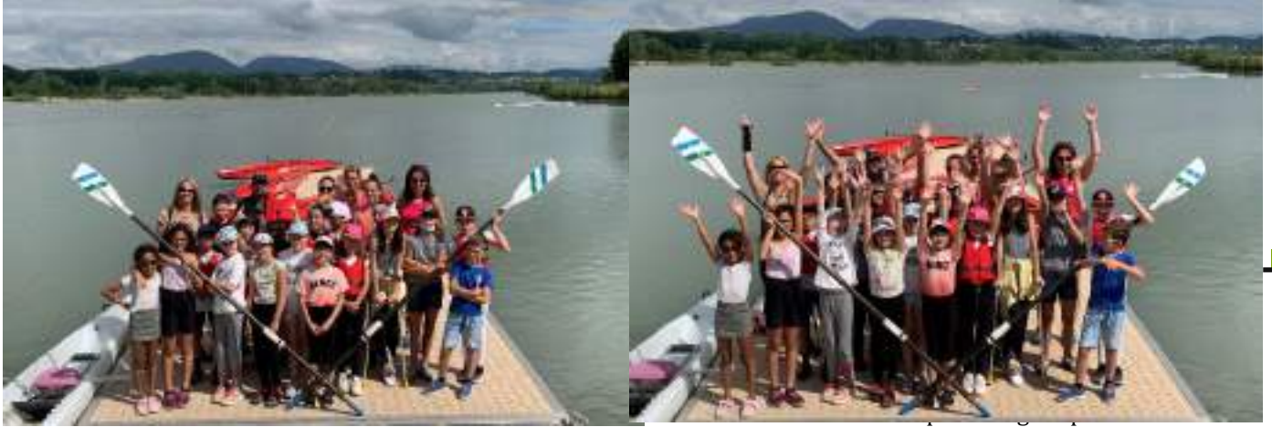
Les CM1 et CM2 de l'école de Virignin

Nous avons eu également la chance pour certains de pouvoir promener nos parents en bateau.